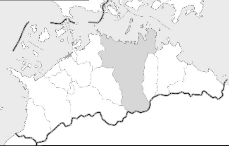
たかまつし ちゅうしんぶ 高松市の中心部のようす