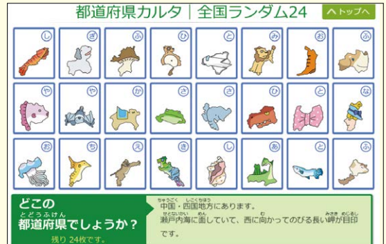
都道府県カルタ デジタル地図帳『楽しく学ぶ小学生の地図帳』

道府県名を導き出し、その形のカルタを選択するため、①のフラッシュカードよりもやや難度が高くなっています。これがスムーズにできたら、47都道府県の名称の学習はほぼ完ぺきといってもよいかもしれません。