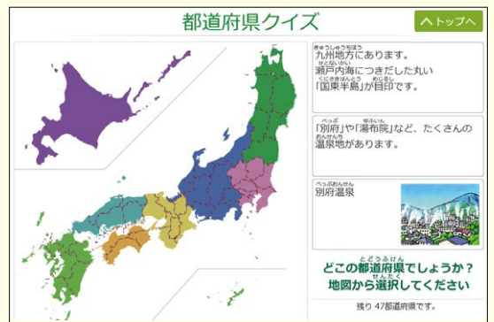
都道府県クイズ デジタル地図帳『楽しく学ぶ小学生の地図帳』

①のフラッシュカードで使用した三つのヒントから都道府県を探し当てるクイズです。答えは名称ではなく、その都道府県の位置をクリックして答える形式になっているため、都道府県の位置を正しく理解しているか確認することができます。