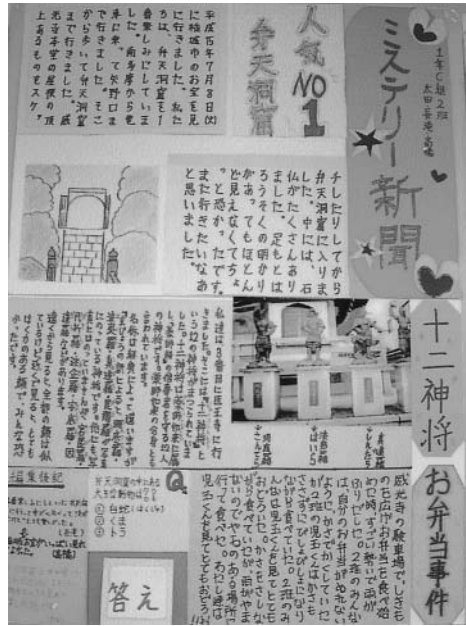
「総合的な学習の時間」に作成した壁新聞

そこで、生徒が調査活動した場合を想定して、綿密に調査した。とくに、三択クイズの問題作成を念頭において、鳥居や地蔵などの石仏などに、年代が分かるものが刻まれているかをチェックすることがポイントである。デジタルカメラなど