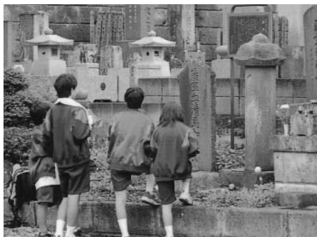
興味深く石造物を調査する生徒