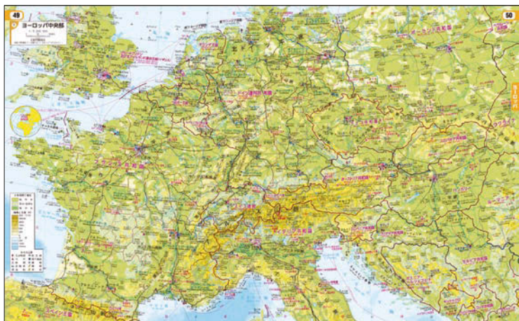
▲新詳高等地図 紙面データ 049-050 ヨーロッパ中央部

生徒用の端末で地図帳紙面を表示させたい場合は、学習者用デジタル教科書をご購入ください。