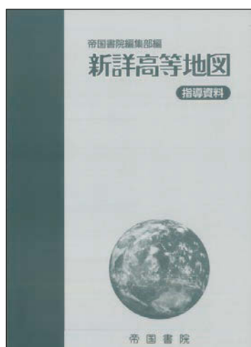
新詳高等地図 指導資料

弊社地図帳の指導資料(指導書)には、 指導書Webサポートとして 紙面PDFデータ を収録。 プロジェクターで大きく投影して活用できます!