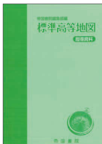
標準高等地図 指導資料