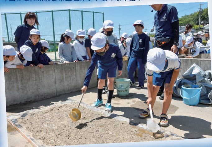
塩田に三河湾の海水を まく3年生