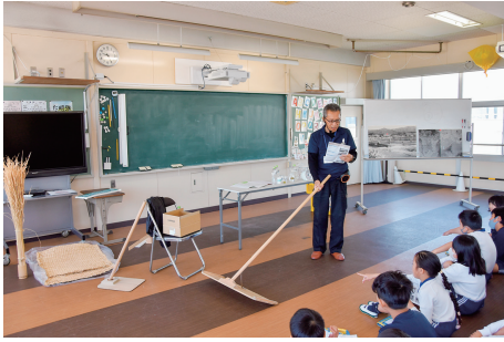
①塩づくりオリエンテーションでは、道具に興味津々。