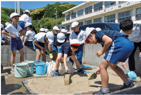
②ミニ塩田に砂を敷き、塩づくり開始。