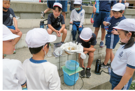
③毎日海水をまいてきた砂に海水を注ぎ、透明な「かん水」が出てくる様子を観察。