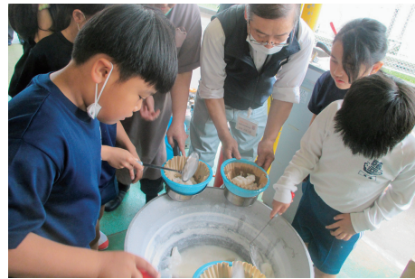
④地域の方と一緒にかん水を煮詰める塩焼き体験。「塩津の塩」ができました！