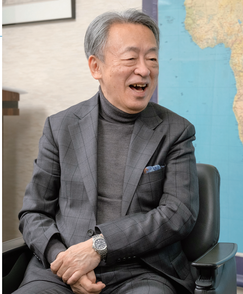
ジャーナリスト いけがみ あきら 池上 彰 (聞き手)

1950年、長野県生まれ。ジャーナリスト。名城大学教授。慶應義塾大学卒業後、73年、NHK入局。報道記者として勤務。94年から11年間、「週刊こどもニュース」で子どもたちにわかりやすくニュースを解説。2005年、NHKを退局。『池上彰の君と考える戦争のない未来』（理論社）、『池上彰の社会科教室』（帝国書院）など著書多数。本誌の対談を集録した『池上彰が聞いてみた「育てる人」からもらった6つのヒント』（帝国書院）も好評発売中。最近では、カナダに事実上亡命した香港の民主活動家・周庭さんをトロントで取材。