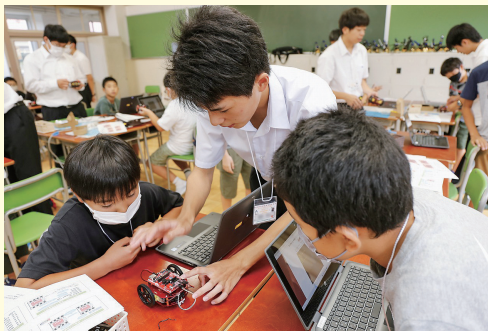
写真（上）：電算機部の生徒が講義を担当。グループごとに丁寧な指導し、児童たちにプログラミングの楽しさを伝える。 写真（下）：最新機種「SkyBerryJAM®CarGo」の実験。黒いラインの通りに走行すると、子どもたちから歓声が上がる。