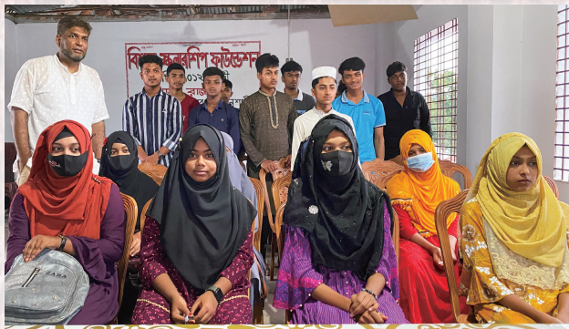
バングラデシュの奨学金財団の学生たち (後列左端が筆者。ラジシャヒ県バガ市。2023年撮影)

トへの出場があります。そのときは「ここがへん日本の学生」という題目で、優勝することができました。スピーチの内容は、日本に来て感じたバングラデシュの学生と日本の学生の違いについてです。