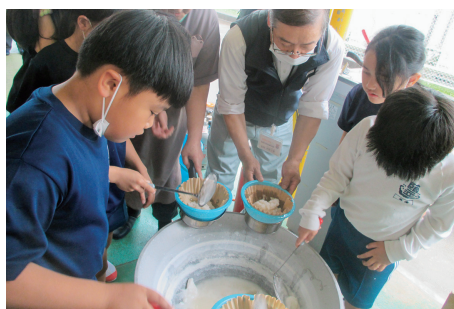
④地域の方と一緒にかん水を煮詰める塩焼き体験。「塩津の塩」ができました！