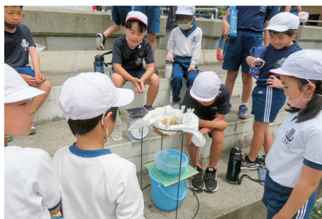
③毎日海水をまいてきた砂に海水を注ぎ、透明な「かん水」が出てくる様子を観察。