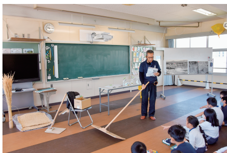
①塩づくりオリエンテーションでは、道具に興味津々。