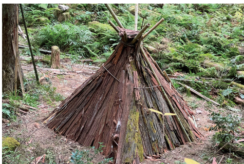
家の骨組みとなる竹を手づくりの石器で切る様子(上)と、完成した家(下)(東京の森にて。撮影：関野吉晴)。