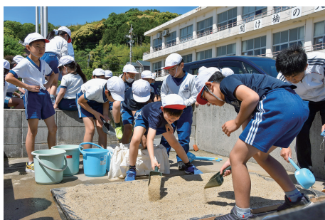
②ミニ塩田に砂を敷き、塩づくり開始。