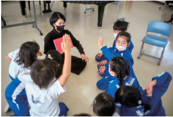
福島県浪江町立なみえ創成小学校 での哲学対話は、5年続けている。 車座の哲学対話はいつも活発だ。

「では、思いやりとはとにかく大切ということ で本当にいいですか？」などと質問します。 すると、「あ、そっちの方向も話していいん だ」と再び対話が勢いづくものです。